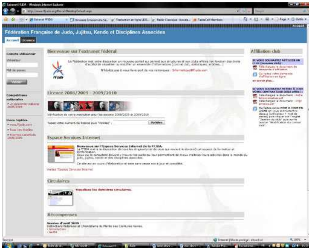
Page d'accueil du portail

En cas de défaut de ce code, envoyez un courriel à jerome.droissart@ffjudo.com